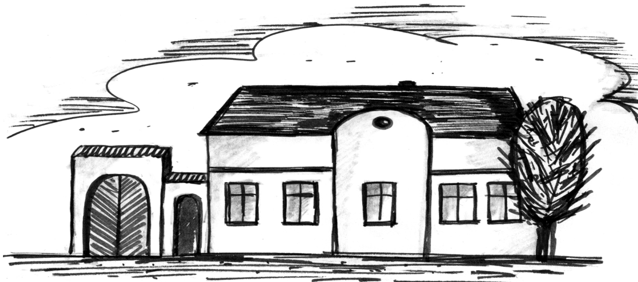
Bývalá hospoda u Bendů

Hospoda také začala být postupně především místem zábavy. Čas od času se tu pořádaly „muziky“ a oslavy posvícení, poutí, masopustu či dožíněk. Mudrovalo se zde o životě, povíдалo a naslouchalo. Život obecně se vyznačoval mnohem menší uspěchaností než dnes. Lidé měli více času pro sebe i pro své bližní. A to i přesto, že se více, a hlavně poctivěji, pracovalo. Ve vzájemných vztazích byla úcta, slušnost a zdvořilost. Lidé tehdy žili mnohem skromněji ale mnohem více jako lidé.